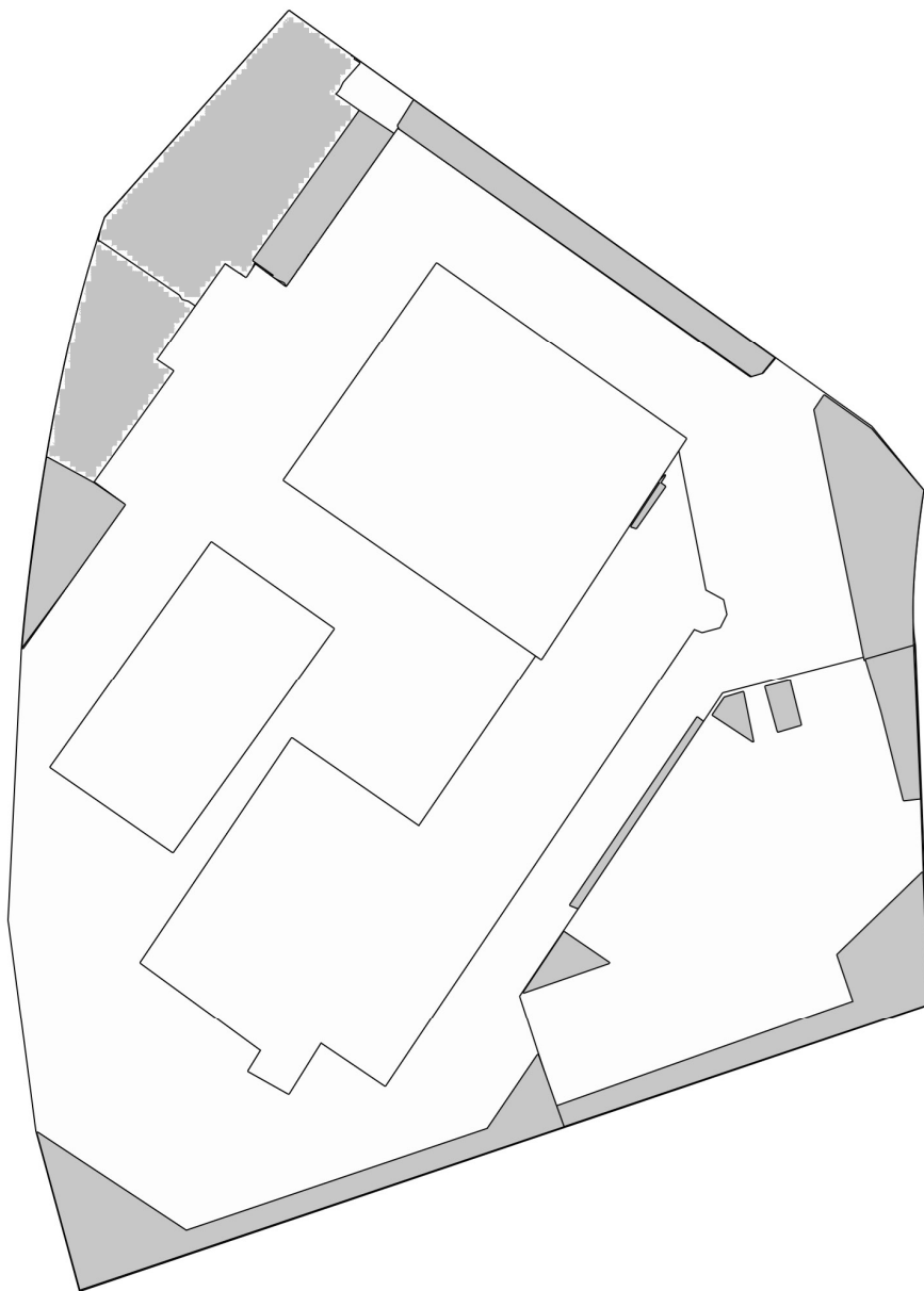
圖一：園圃區域圖則