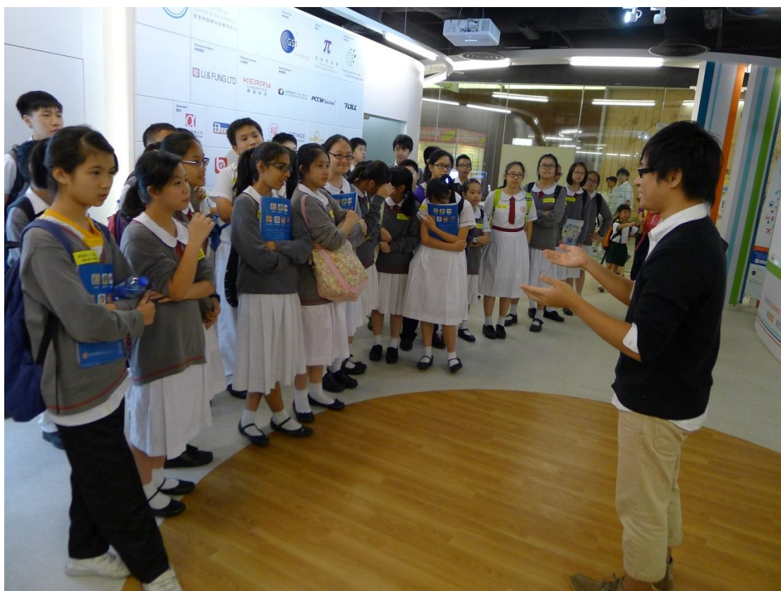
物聯網樂趣多導賞團