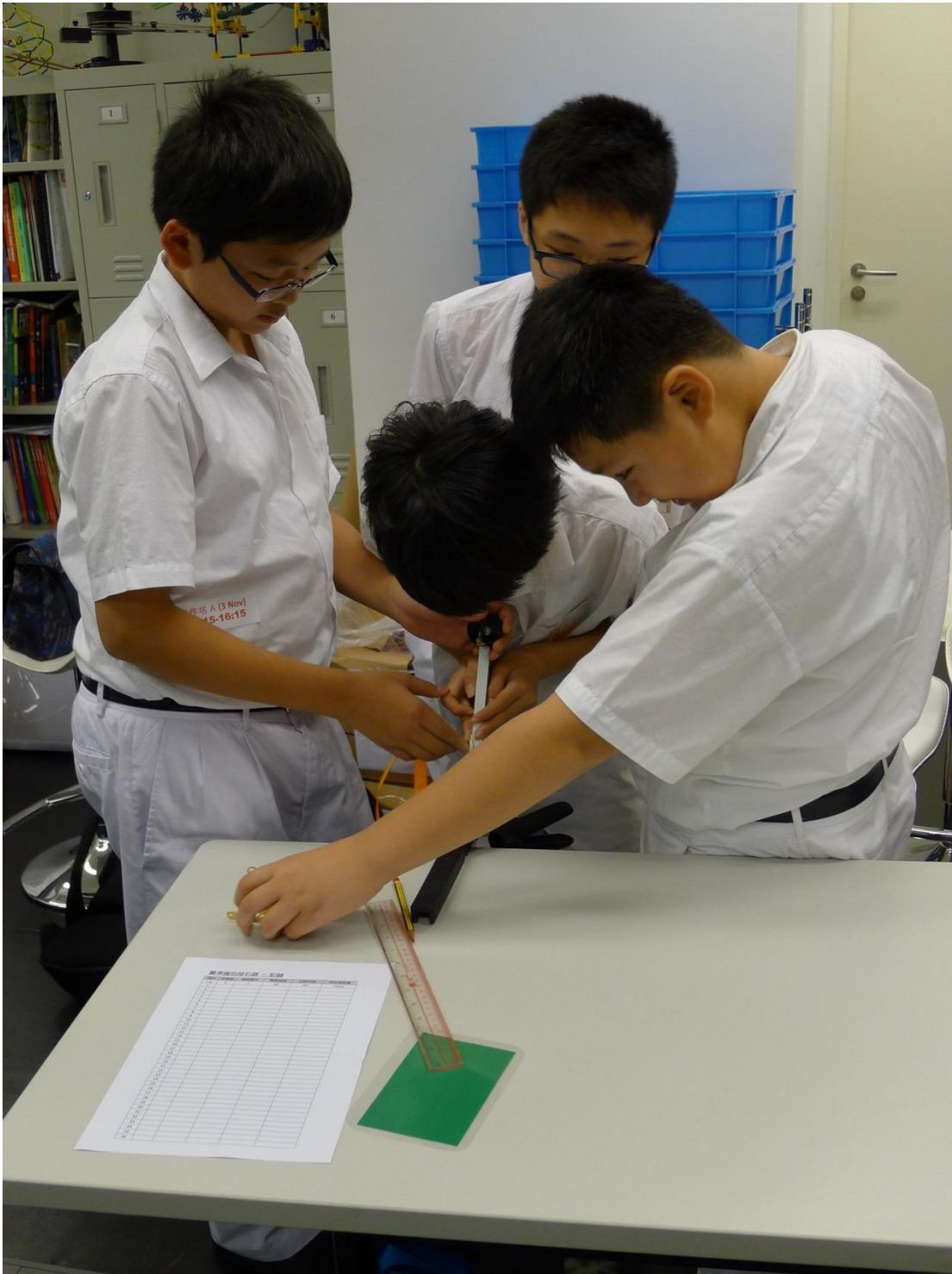
進擊的投石器工作坊(實驗情況)