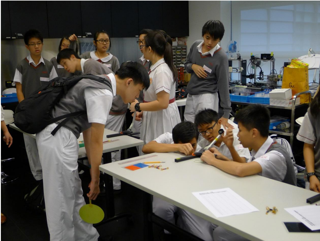
進擊的投石器工作坊(實驗情況)