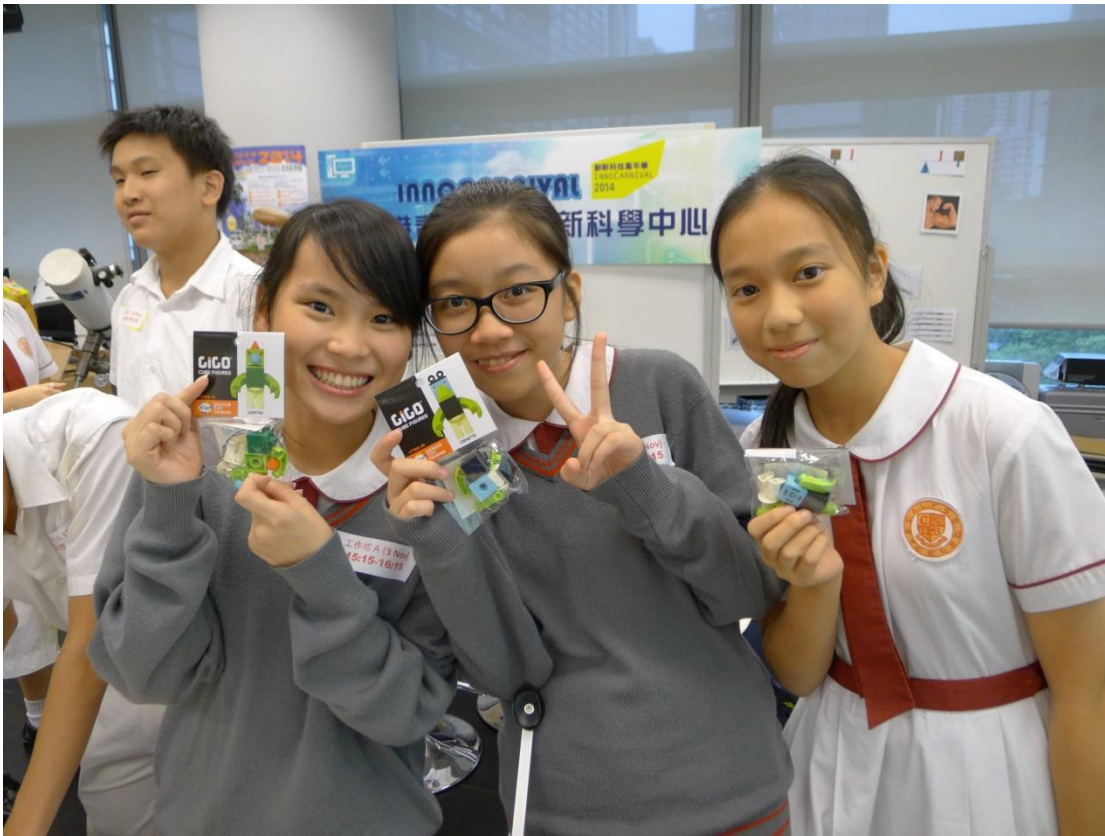
進擊的投石器工作坊(遊戲中得勝的同學)