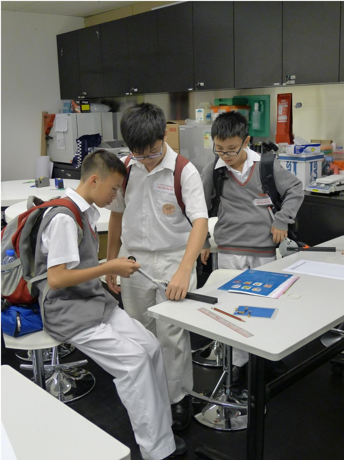
進擊的投石器工作坊(實驗情況)